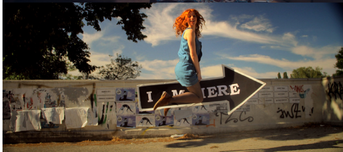
NASHORN IM GALOPP ERIK SCHMITT ALLEMAGNE / 14'59 / 2013

Une brève rencontre avec une réfugiée syrienne traumatisée bouleverse le monde d'Isaf, âgé de douze ans.