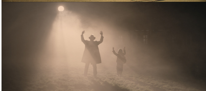
VAN EGY HATÁR (OPERATION STONE) BARNABÁS TÓTH POLOGNE / 18' / 2018

Bruno erre dans les rues de Berlin, la tête pleine d'interrogations, à la recherche de ce qui se cache derrière les innombrables façades et édifices. Il cherche à saisir l'âme de la ville, ce petit quelque chose que les autres ne remarqueront peut-être jamais.